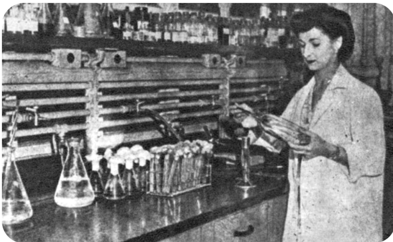
"Química Farmacéutica" [fotografía]. (1948).

Hacia fines del siglo XIX, las carreras elegidas por las primeras mujeres universitarias fueron derecho y medicina. Pasados cincuenta años del decreto Amunátegui, la incorporación de las mujeres a la vida universitaria se había ampliado de manera sustantiva a carreras como las de química y farmacia, odontología, pedagogía, obstetricia, enfermería y servicio social.