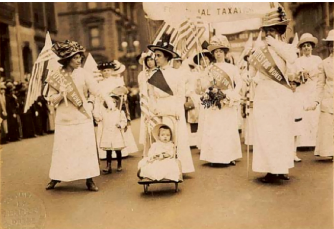
"La Marcha por el Sufragio Femenino, desfilando por la Quinta Avenida en la ciudad de Nueva York" (1912) [Fotografía].

¿Por qué se conmemora el Día Internacional de las Mujeres Trabajadoras?