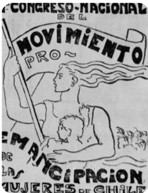
Afiche Primer Congreso Nacional MEMCH (1937).

¿Por qué se conmemora el Día Internacional de las Mujeres Trabajadoras?