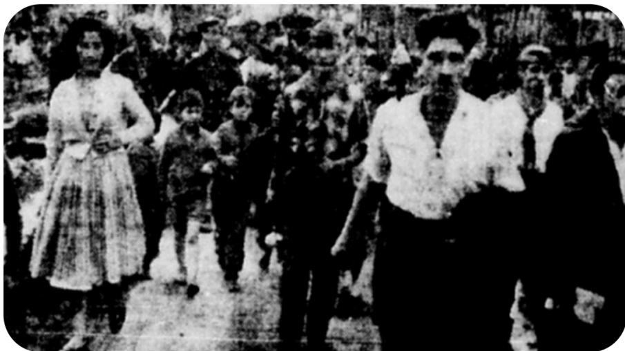
Diario El Siglo "Marcha Lota-Coronel." (1960) [Fotografía]. Recuperado de http://patrimoniogenero.dibam.cl

En Lota, la ciudad del carbón, hubo mujeres que jugaron un papel en la producción del carbón, específicamente en la limpieza y clasificación.