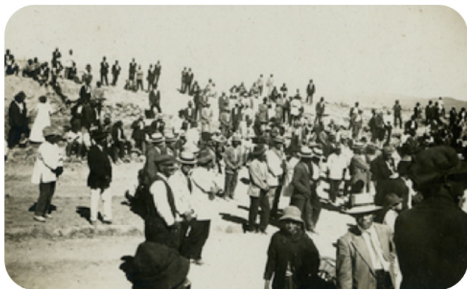
Obreros del salitre acuden a un mitin. (Sin fecha) [Fotografía]. Recuperado de http://www.museohistoriconacional.cl Colección: Biblioteca Nacional De Chile

En la siguiente fotografía, se logran observar algunas mujeres en instancias de la época.