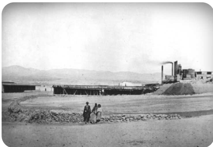
Fotografía Donada por González, S. Huara, Chile (1910) [Fotografía]. Recuperado de www.memoriachilena.cl Colección: Biblioteca Nacional De Chile