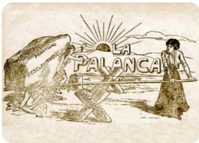
Revista La Palanca (1908). [Imagen]. Recuperado de www.memoriachilena.cl

Las mujeres nortinas, específicamente de la antigua región de Tarapacá (actuales XV y I regiones), tuvieron un largo historial de lucha y participación social y política, característica que arranca desde principios del siglo XX, en la pampa salitrera, pero que se ha ocultado tras la historia oficial, que invisibilizó la existencia y fuerza del movimiento obrero femenino (Carrasco, 2014).