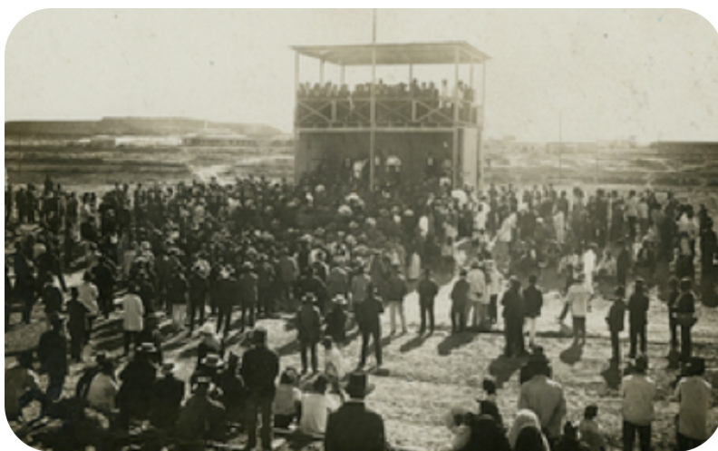
Reunión de obreros en una salitrera. (Sin fecha) [Fotografía].

Se crearon organizaciones como las sociedades mutualistas o de socorros mutuos –de obreras- cuyo fin era mejorar el nivel de vida de sus asociadas; las que luego derivaron en las “sociedades mancomunales”, que abogaban por el mejoramiento de las condiciones laborales y la conciencia de clase entre sus miembros. Si bien inicialmente apelaron a las mujeres en su calidad de hermana y esposa del obrero, luego se les llama a incorporarse como trabajadoras (Carrasco, 2014).