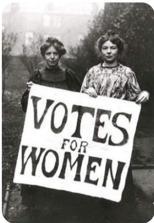
Trabajadoras Textiles luchando por sus derechos, Siglo XX (sin fecha) [Fotografía].

Clara Zetkin defendió la importancia del trabajo como una condición indispensable para la independencia económica de las mujeres.