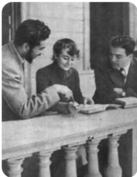
Sanhueza, M. E. (1949). "La mujer en la Universidad". [Fotografía].

Es un día para declarar y reivindicar la igualdad de género, especialmente en el mundo del trabajo. Lo que implica analizar las brechas, celebrar los logros y evaluar nuevos caminos para seguir mejorando la participación igualitaria de hombres y mujeres en el mercado laboral.